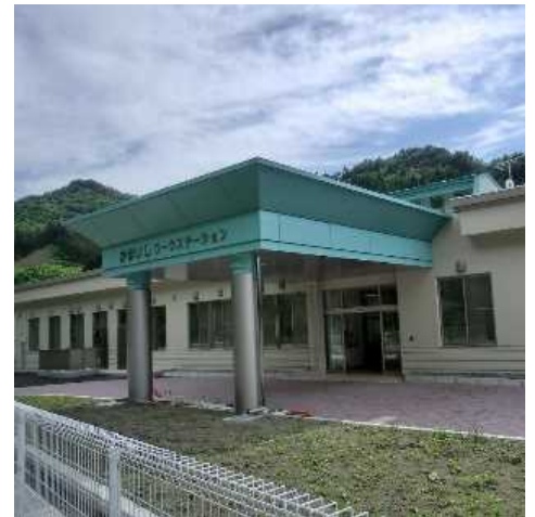
かまいしワーク・ステーション