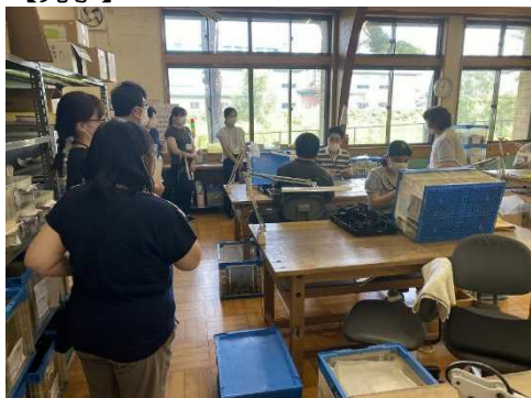
それぞれの仕事を頑張っています