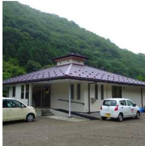
まごころ就労支援センター釜石

アセスメント実施に関わり、保護者の皆様にも情報提供や会議等への参加を依頼する事がありますので、ご協力よろしくお願いします。