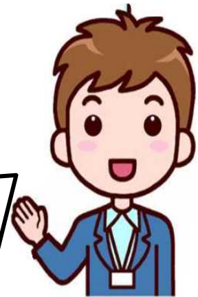
相談支援専門員 A さん

福祉サービスを利用するとき、利用計画を私たちが作成します。生徒さんのことを知らないと書くことができません。なるべく早くから関わりを持たせていただければ嬉しいです。