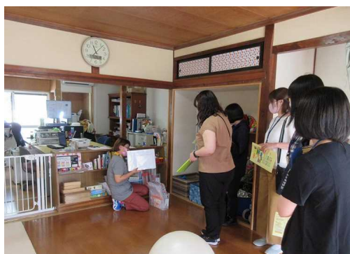
遊戯室：個別の学習課題やゆっくりできるスペースもありました