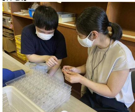
卒業生がやり方を教えてくれました