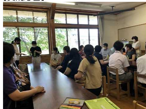
たくさんの質問に答えていただきました